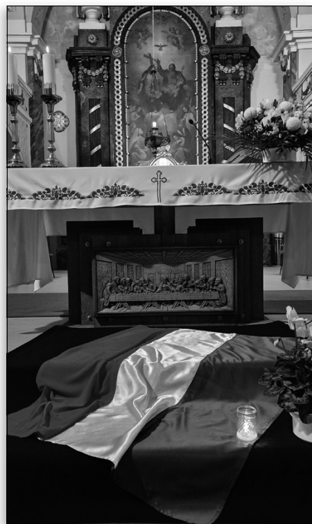
Az 1956. október 23-i forradalomra emlékezve, egy nappal korábban, október 22-én az egyház is tisztelettel adózott a hősök emlékének. A szentmise előtt a templomkertben álló '56-os emlékműnél koszorúzással fejeztük ki megbecsülésünket.