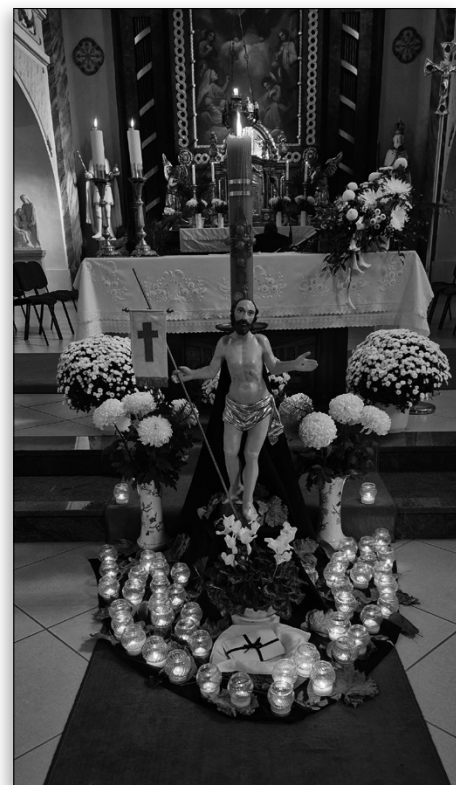
November 1-jén közös napon ünnepeljük az összes szentet és emlékezünk szeretteinkre. A szentmisén az elmúlt évben elhunytakért égett a mécses.