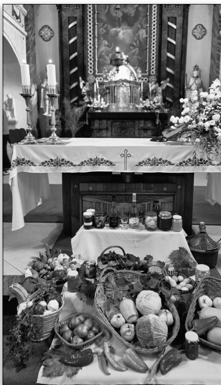
2025. október 6-án tartottuk a terménybetakarítási hálaadó ünnepséget, ahol köszönetet mondtunk az idei bő termésért. A szentmise során közösen imádkoztunk a földművesekért és a mezőgazdasági áldásért.