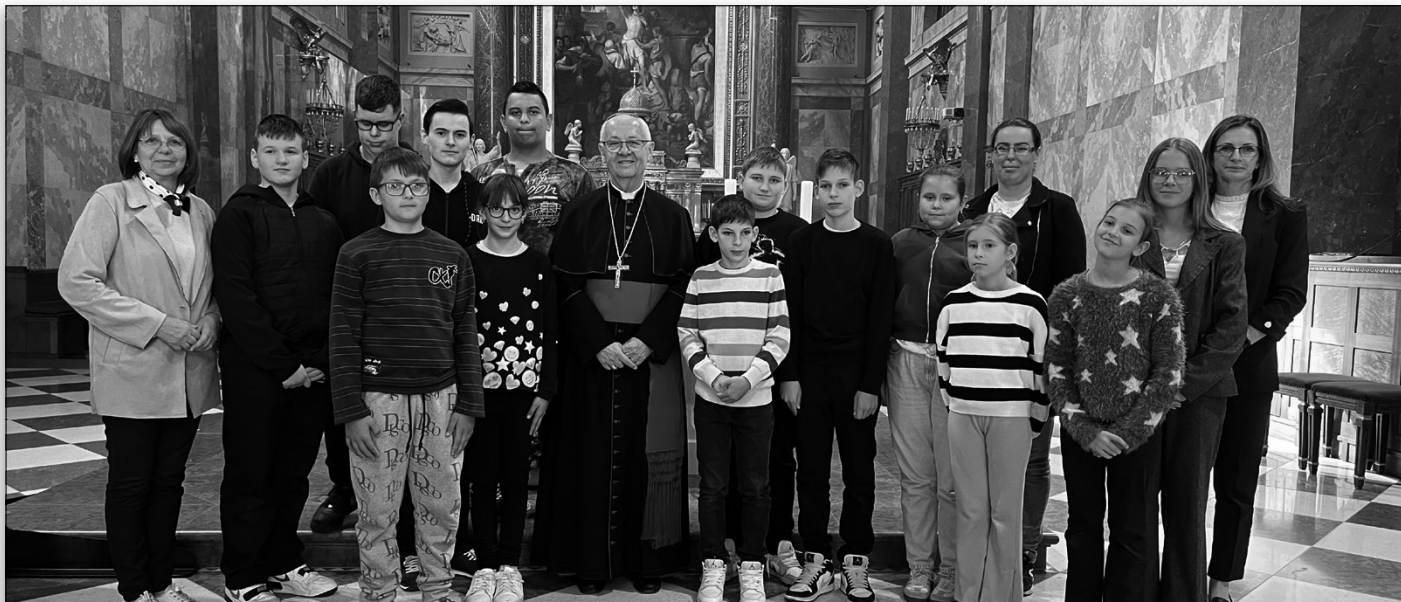
2025. október 4-én Egerben ministránstalálkozón vehettünk részt, amelyen a három plébánia ministránsai együtt képviselték közösségeiket. A találkozó során közös imádságban és szent liturgiában gazdagodhattunk, megerősítve hitünket és szolgálatkészségünket